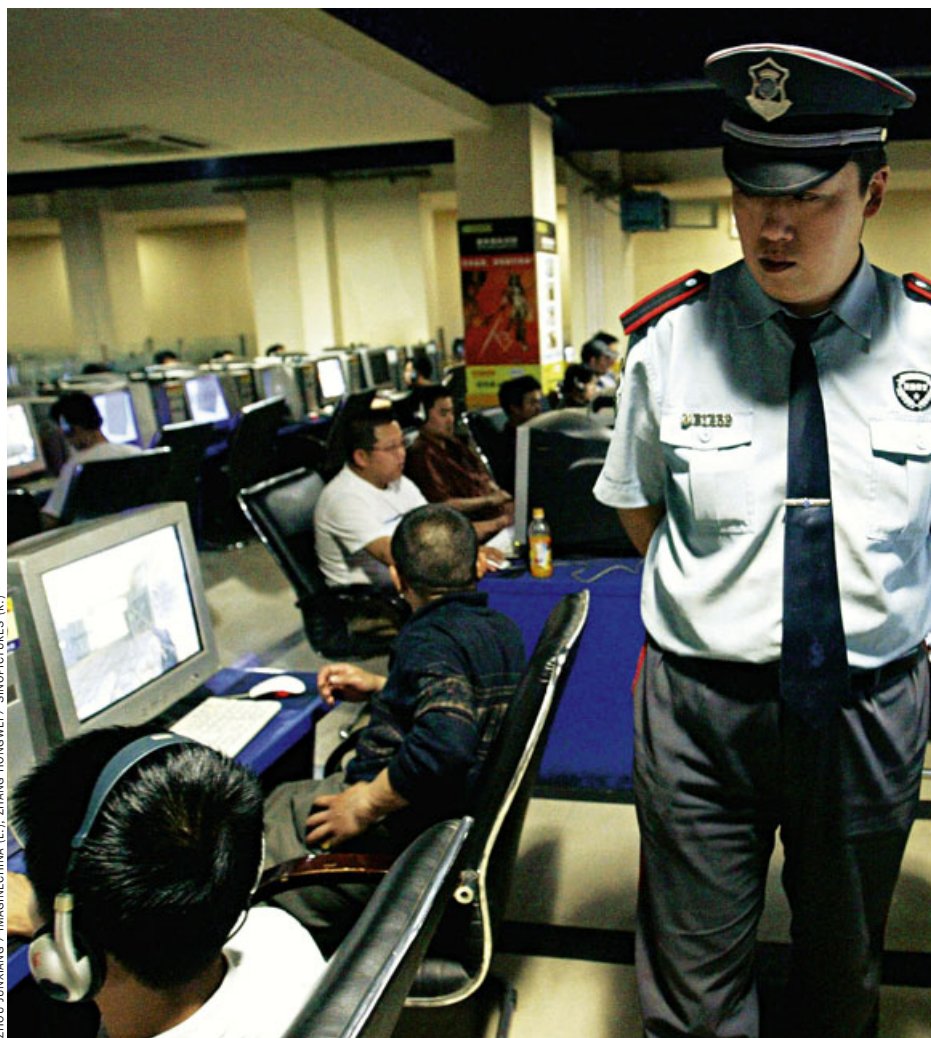
Polizei-Comicfigur als Ermahnung im Netz, Kontrolle in einem Internet-Café (in Xian): Chronisches Katz-und-Maus-Spiel zwischen Bloggern

Das Internet sei atombombensicher konstruiert. So hieß es. Es zu zensieren sei so sinnlos wie der Versuch, einen Wackelpudding an die Wand zu nageln. Da waren sich alle einig. Wenn dem Datenstrom irgendwo Widerstand drohe, suche er sich einfach einen anderen Weg. Sagten die Experten. Dumm nur, dass China nicht mitspielt.