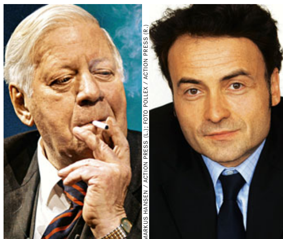
Interviewpartner Schmidt, di Lorenzo: „Unersetzlich“

Di Lorenzo: Ich bitte Sie! Helmut Schmidt ohne Zigarette ist einfach unvorstellbar. Und ich gönne ihm das von Herzen. Außerdem heißt das Format ja „Auf eine Zigarette mit Helmut Schmidt“.