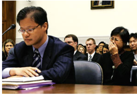
Yahoo-Gründer Yang* „Durch China verändert worden“